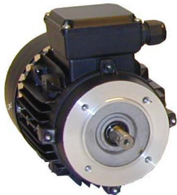
B14 Flänsmotor, Liten fläns med gängade fästhål